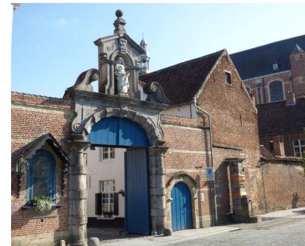
Eingang Begijnhof Lier

Exerzitien- und Gästehaus Sankt Ottilien